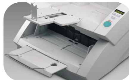
Alimentation extrêmement fiable

Ces modèles vous garantissent une haute qualité de numérisation. Résolution optique de 600x600 ppp, fonction de lissage couleur pour réduire l'effet de moiré et accroître la qualité, mode texte amélioré poussé améliorant la lisibilité des lignes fines et des textes faiblement contrastés : l'assurance d'images proches de la perfection. Bénéficiez également d'images plus nettes, grâce au système de double éclairage qui supprime les ombres liées aux pliures du document.