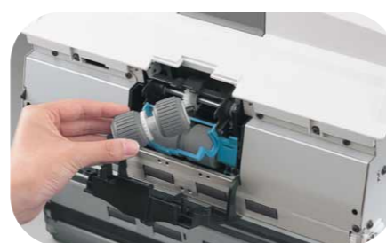
Rouleaux changeables par l'utilisateur

Les deux modèles acceptent différents formats et épaisseurs de papier en lots mélangés même un peu supérieurs au A3. De plus le DR-9080C dispose de la couleur 24 bit pour des applications aussi variées que la numérisation de graphiques couleurs, tableaux, présentations.