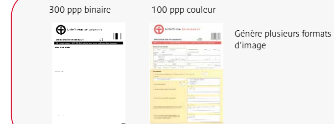
Génère plusieurs formats d'image

Toutes les fonctionnalités de ces scanners ont été conçues pour améliorer leur fiabilité. Ils disposent d'un mode de détection de double alimentation pour les feuilles passant par deux. Ils utilisent pour cela un signal ultrason qui détecte les doubles alimentations et fait s'afficher un code erreur. Il y a aussi une détection de documents agrafés un point qui arrête automatiquement la numérisation lorsque le scanner détecte des documents comportant une agrafe.