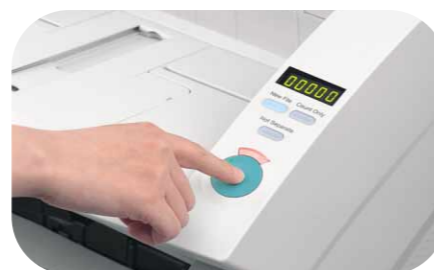
Panneau de contrôle simplifié

Afin d'améliorer substantiellement les vitesses de numérisation, les deux modèles disposent de la compression JPEG interne et de nouveaux capteurs CIS (Contact Image Sensor). Vous atteignez ainsi des vitesses supérieures à 90 ppm aussi bien en N&B ou en niveaux de gris (A4 portrait, 200 ppp) qu'en couleur (A4 portrait, 100 ppp) 1 . Ajoutez à cela une vitesse maximale de 180 ipm en Recto/Verso et vous bénéficiez d'une productivité incomparable.